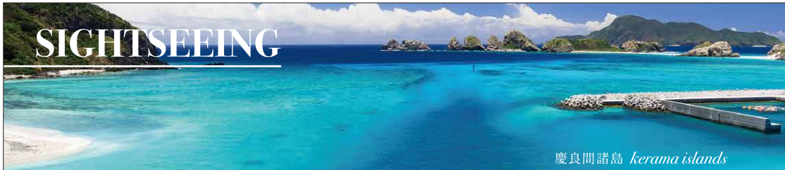
慶良間諸島 kerama islands