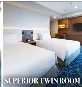
SUPERIOR TWIN ROOM